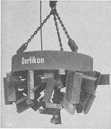
Abb. 2. Hebemagnet von 1500 mm Durchmesser.

sowohl des Gehäuses wie der Spule darstellt (Abb. 1). Als Stromart kommt nur Gleichstrom in Betracht, da es bisher nicht gelungen ist, Wechselstrom zu diesem Zwecke direkt verwendbar zu machen. Einen runden Hebemagneten, und zwar von 1500 mm Durchmesser, zum Fördern von Schrott bestimmt, zeigt Abb. 2. Bei einem Stromverbrauch von etwa 4,8 kW kann er durchschnittlich 700 bis 1000 kg