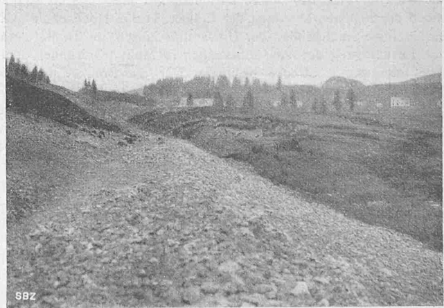
Abb. 30. Bodenaufpressung seitlich des Bahndammes im Sumpf des Doubstales bei l'Abergement.