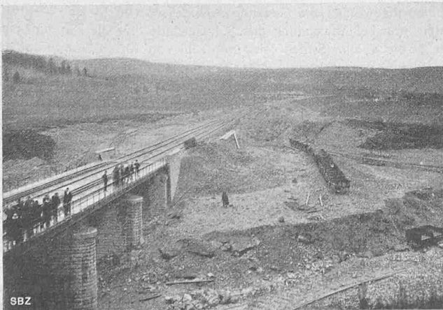
Abb. 32. Gesamtbild der Sumpfstrecke, gegen S gesehen, mit der Brücke über den verlegten Doubs.

Aus den Befunden musste der Schluss gezogen werden, dass die Ueberbrückung viel grössere Schwierigkeiten und unvergleichbar grössere Kosten mit sich bringen würde, als die Anlage eines Dammes, auch wenn angenommen werden musste, dass ein bedeutender Teil des Auffüllmaterials in den weichen Untergrund einsinken werde. Es wurde also die Anlage eines Dammes auch über den Sumpfboden beschlossen, mit Ueberbrückung blos des Doubs. Indessen zeigte die Aufschüttung des Dammes recht bald, dass nicht nur das Aufschüttungsmaterial vorweg in den Sumpfboden einsank, sondern auch, dass zugleich der Torf und der darunterliegende Schlammboden links und rechts vom Damm in die Höhe quollen, bis 4 m hoch über die ursprüngliche Geländehöhe (Abb. 30). Es war sogar Gefahr vorhanden, dass der provi-