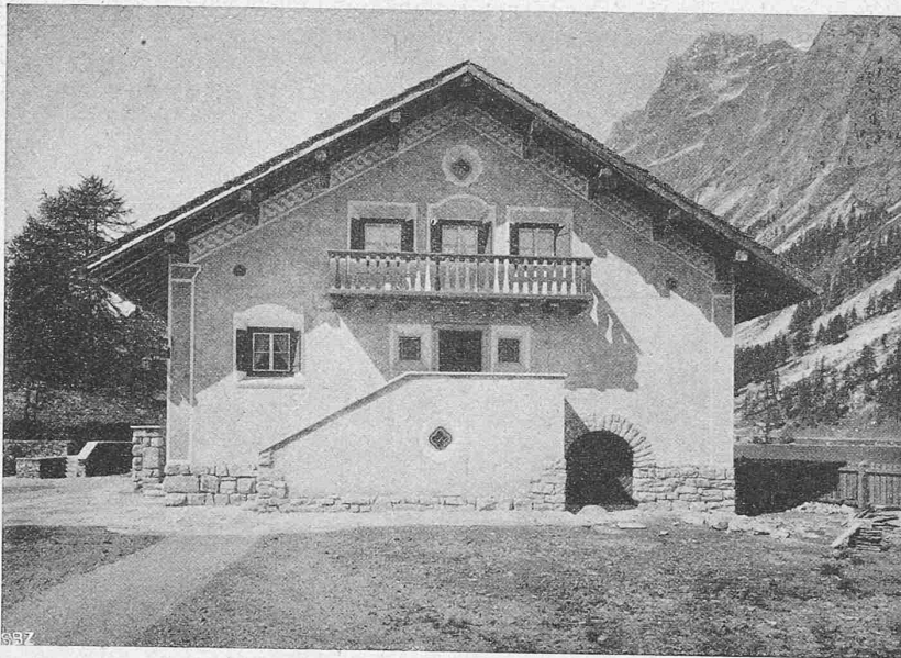
Abb. 4. Ostfront des Ferienhauses Bartuns am Silsersee, Engadin.

Im Erdgeschoss, 2,30 m über dem umgebenden Gelände, liegt gegen Süden ein Wohnraum mit Kamin-Nische, ganz in feinjähigem Lärchenholz ausgeführt (Tafel 2 und Grundriss), daneben Küche, ein Schlafzimmer und zwei Aborte; darüber im Obergeschoss ein grösserer und zwei kleinere Schlafräume und ein Badezimmer. Die Zwickelräume des Satteldaches sind für Schränke u. drgl. ausgenutzt. Im Ganzen bietet das Haus Raum für acht Betten. Im Untergeschoss sind Keller und Zentralheizung unter dem Wohnraum, auf der andern Seite ein geräumiges Boothaus für eine Segelboot, ein Ruderboot und eine Jolle, mit Aufzug-Vorrichtung für die Boote, eingebaut, sodass auch für den Wassersport alles Nötige vorhanden ist. Der über 4 km lange Silsersee eignet sich, im Gegensatz zu den meisten Gebirgseen, seiner stetigen Winde wegen, recht gut zum Segeln, sodass die Lage dieses Ferienhauses eine in jeder Beziehung ideale genannt werden muss.