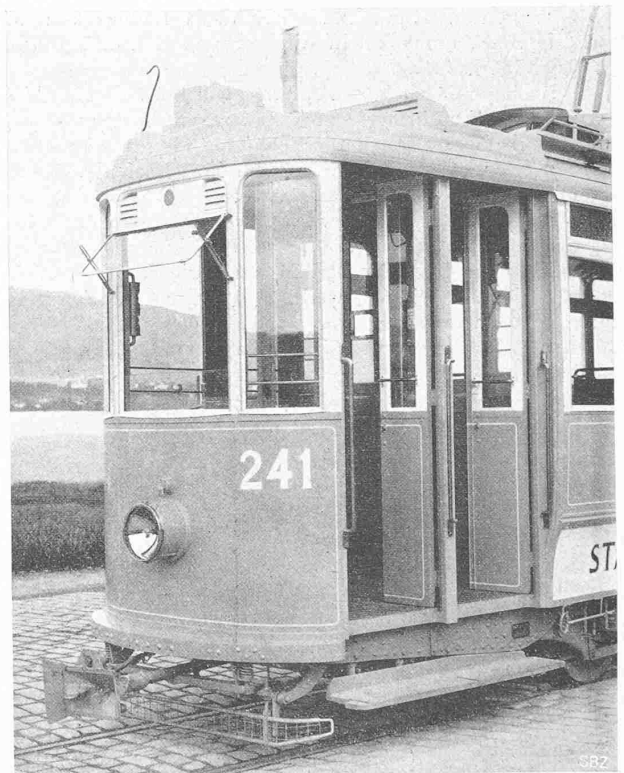
Abb. 6. Hinteres Motorwagen-Ende, Ein- und Ausstieg-Türen.