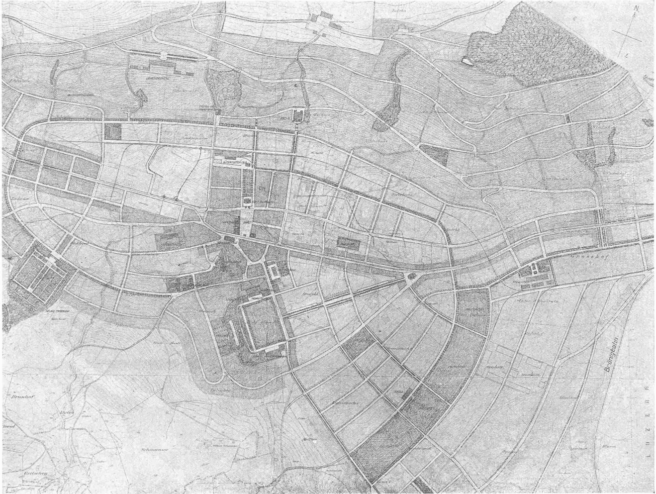
II. Preis ex aequo. Entwurf Nr. 5. — Verfasser: Arch. Paul Artaria und Arch. Karl Zaeslin in Basel. — Ausschnitt aus dem Gesamtplan. — Masstab rund 1:12000.

in Aussicht genommene Ueberbauung des bestehenden Dorfplatzes mit einem Gewerbehause und die Verbauung der alten Kirche mit mehrgeschossigen Häusern ist abzulehnen.