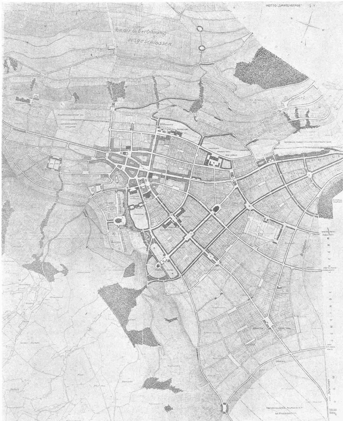
II. Preis ex aequo. Entwurf Nr. 10. — Verfasser: Architekt Alois von Moos in Luzern. — Oestlicher Teil des Gemeindegebietes, rund 1:15000.

In Würdigung dieser Gesichtspunkte werden nach einem ersten Rundgang ausgeschieden die Projekte Nr. 1, 2, 4, 7, 19, 21, 22 und 25.