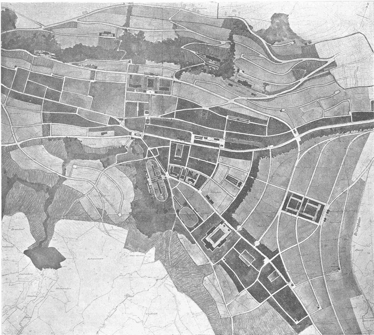
Angekaufter Entwurf Nr. 6. — Arch. von Gunten & Kuentz in Bern mit dem Ingenieurbureau Losinger, Burgdorf. — Ausschnitt aus dem Bebauungsplan. — 1:12000.

Nach eingehender Abwägung der Vorzüge und Mängel der in engerer Wahl verbliebenen Projekte kam das Preisgericht einstimmig zu der Ansicht, dass keines der besprochenen Projekte die aufgestellten Bedingungen erfüllt und diejenigen Qualitäten besitzt, die zur Erteilung eines I. Preises erforderlich sind, und das ohne weiteres zur endgültigen Bearbeitung dienen kann.