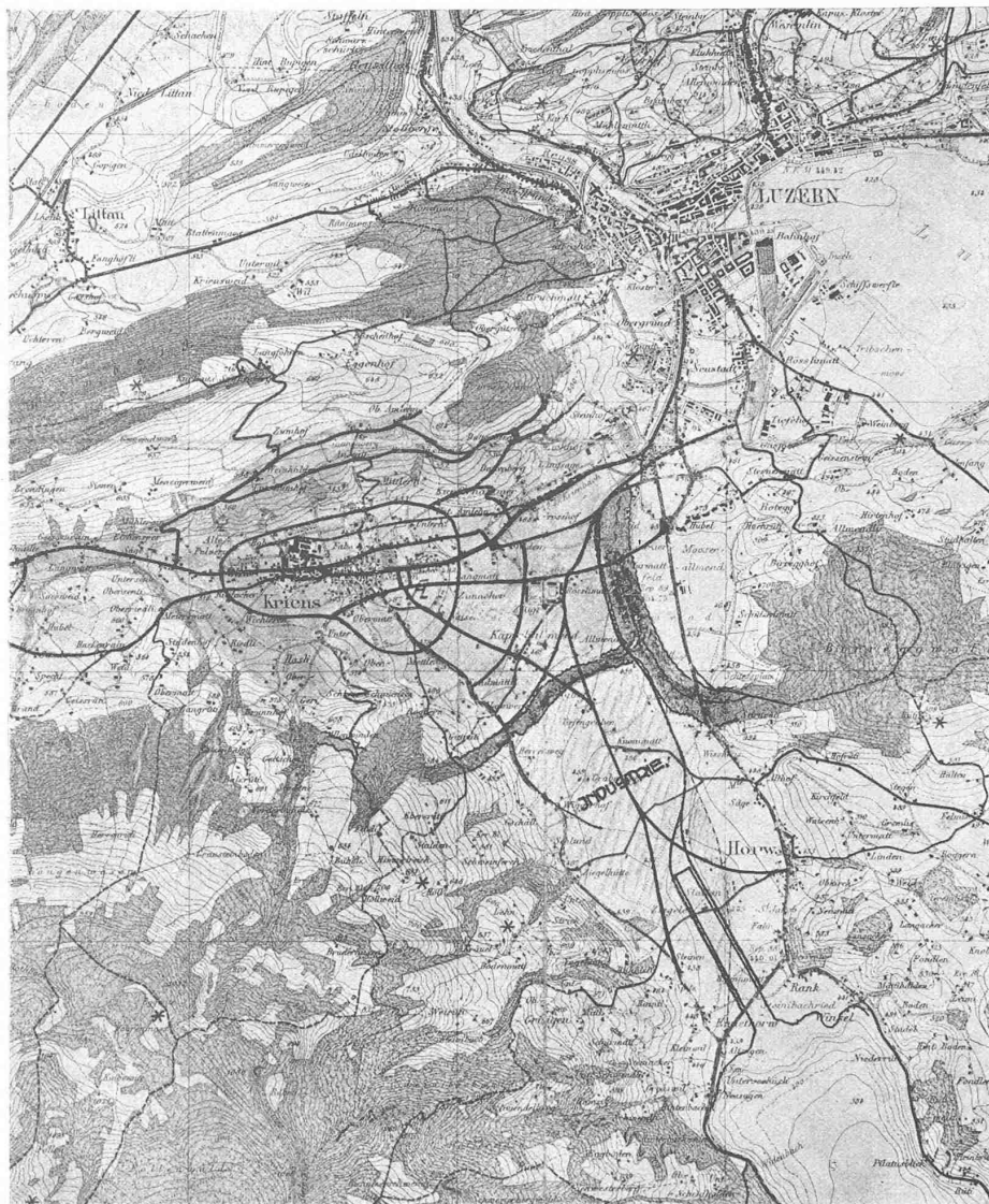
III. Preis. Entwurf Nr. 23. — Uebersichtskarte von Kriens und Umgebung. — Masstab 1:40000.