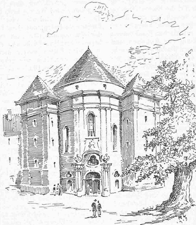
Abb. 10. Westfront (unvollendet) der Klosterkirche Wiblingen, erbaut 1772/81.

Um die Rotunde laufen sie als schmaler Gang herum, am Chor sind sie verschwunden, sodass hier der Gedanke der Einheit des Raumes vollständig erreicht ist, eine einzige mächtige Halle erfüllt den Zuschauer mit dem Gefühl der Grösse. Vier Säulen verstärken die die flache Kuppel tragenden Pfeiler und steigern durch ihre Verhältnisse die monumentale Wirkung des Ganzen. Vergleicht man den Grundriss von St. Gallen mit dem von Wiblingen, so sieht man, wie die schon im ersten erkennbare Absicht der Einheit im zweiten zur vollständigen Ruhe und Klarheit ausgereift ist. Auch ist der Chorabschluss in Wiblingen klarer und mächtiger zum Ausdruck gebracht. Das Hinausrücken der Türme an der Westfront gibt der Fassade Luft und Licht; ihre schräge Stellung schmiegt sich harmonisch der schönen Kurve des Grundrisses an und nimmt sie in die Kreisbewegung des Zentralbaues hinein (Abbildung 10). Die Fassade ist leider unfertig geblieben, entbehrt aber auch so nicht der Monumentalität. Ein reiches Portal belebt die durch zwei Bündel von gekuppelten Pilastern in drei Felder geteilte, gebogene Front, die, von den schräg gestellten Türmen flankiert, wie der Abschluss einer perspektivischen Kulisse wirkt. Diese (wie die Türme offensichtlich unvollendete) Fassade scheint mir eine der besten und originellsten Lösungen der ganzen Gruppe zu sein.