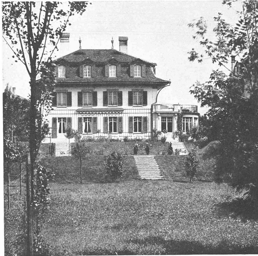
ANSICHT VOM GARTEN HER GRUNDRISSE 1 : 400