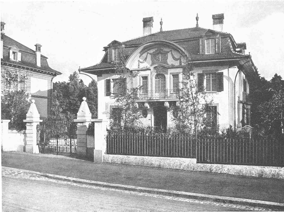
OBEN: ANSICHT VON DER STRASSE