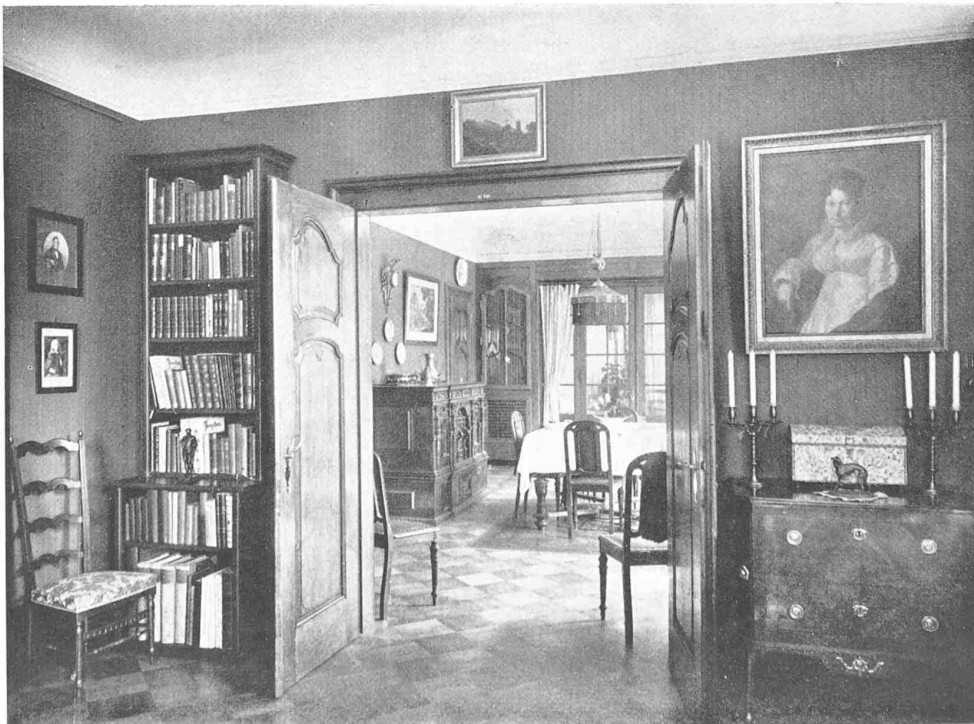
VILLA DR. Z. AN DER KIRCHENFELDSTRASSE IN BERN