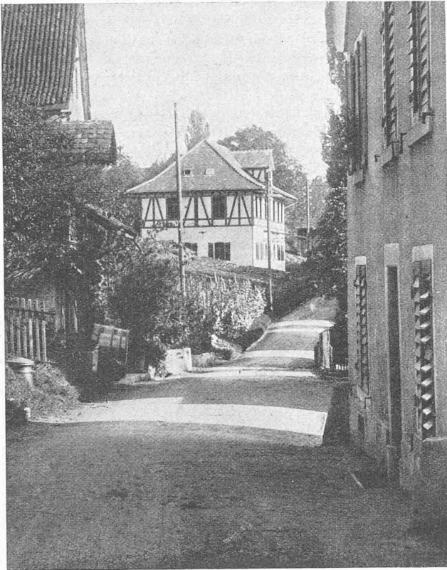
Abb. 2. Ländliches Lagerhaus. Architekt R. v. Muralt, Zürich.

Die Exportenergie soll, wie im Gesuch angeführt, zunächst vom Kraftwerk Mühleberg geliefert, also dem Netz der Bernischen Kraftwerke entnommen werden; später sollen nach unseren Erkundigungen ungefähr gleiche Beträge aus der Nordost- und Zentral-Schweiz und aus dem Bündnerland hinzutreten.