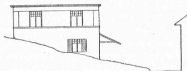
Abb. 1. Ursprüngliche Bauabsicht. — 1:400.

Demnach gibt es bezüglich der künstlerischen Berechtigung einer Verwendung bodenständiger Bauformen kein allgemein gültiges Werturteil. Aber auch wer an dem kleinen Nutzbau in Feld-Meilen am Zürichsee nichts besonderes zu finden vermag, wird doch dem Architekten dafür Dank wissen, dass er den nach Abbildung 1 geplant gewesenen und bei seinem Hinzukommen bereits begonnenen Bau so auszugestalten vermochte, wie ihn nun Abb. 2 und 3 zeigen. Das kleine Lagerhaus weist in drei Geschossen Räume von je 9 \times 20 m Nutzfläche auf, die durch Treppen und Aufzug untereinander und mit der glasüberdeckten Laderampe an der Strasse verbunden sind. Es dient vollkommen seiner Zweckbestimmung, ohne dabei, wie es der ursprüngliche Entwurf getan hätte, sich schon von weitem durch Hässlichkeit als „blosser“ Nutzbau zu präsentieren.