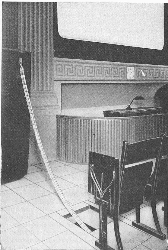
Abb. 5. Elektrische Fussbodenheizung in einem Lichtspieltheater. (Der biegsame Heizkörper ist aus seinem Kanal herausgezogen.)