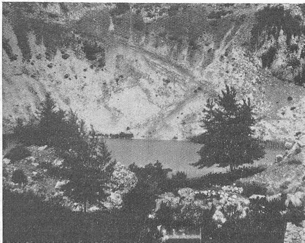
Abb. 5. Der See von Luros in Epirus.

Die Niederschlags- und Abflussverhältnisse sind infolge der grossen klimatischen und topographischen Unterschiede der einzelnen Zonen Griechenlands ebenfalls sehr verschiedene. In Altgriechenland , also dem Pelopones, Mittel- und Alt-Nordgriechenland, Gegenden, die der Mittelmeerzone angehören, treten die Niederschläge hauptsächlich in den Monaten Oktober bis Mai auf. In diesem meist aus kahlem, steilem Kalkgebirge bestehenden Gelände fliesst das Wasser schnell ab und findet wenig Gelegenheit zur Quellenbildung. Viele in der Regenzeit zu ansehnlichen Flüssen anwachsende Wasserläufe versiegen während des meist regenlosen Sommers.