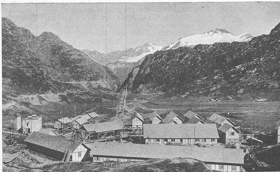
Abb. 2. Alp Emosson mit Werkplatz E, Blick nach Süden.