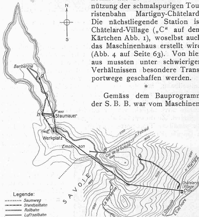
Abb. 1. Uebersichtskarte der Baustelle und Transportanlagen für das Barberine-Kraftwerk der S. B. B. — Masstab 1 : 50 000.

Gemäss dem Bauprogramm der S. B. B. war vom Maschinen-