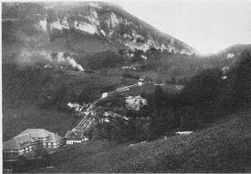
Abb. 3. Rohrleitung und Maschinenhaus des Lungernsee-Kraftwerks, oberhalb Giswil.