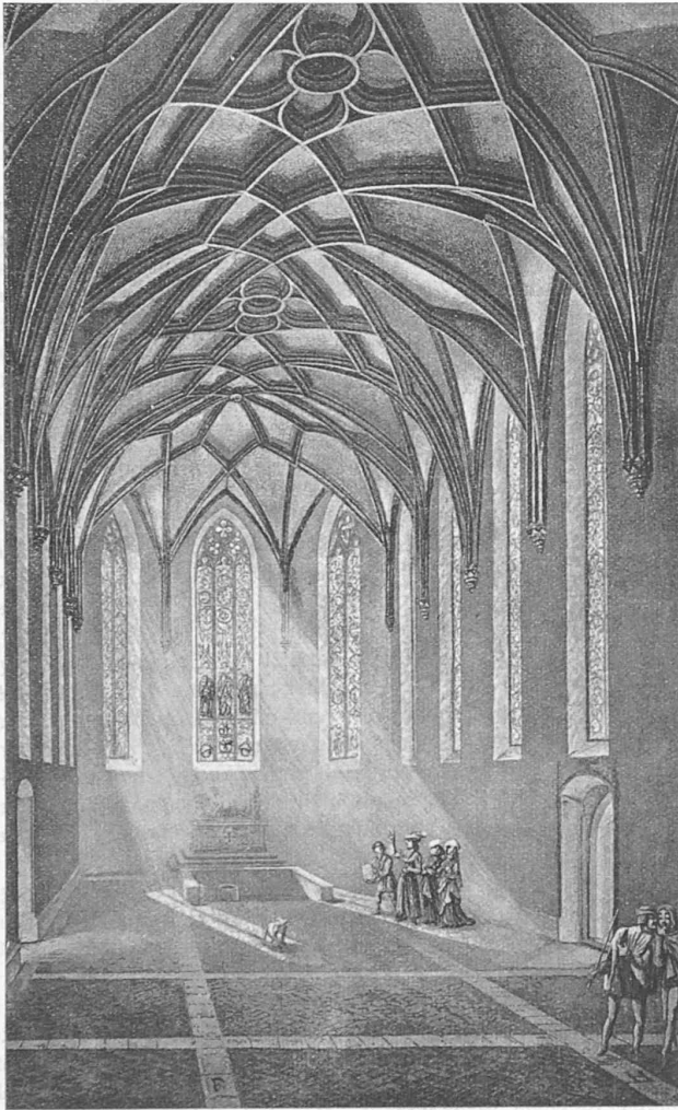
Abb. 1. Rekonstruktion des ursprünglichen Zustandes (nach Hegi).

einem der Wirklichkeit aufs engste angenäherten Versuchsobjekt erweitert und nutzbar gemacht werden können.