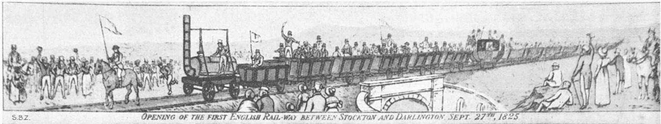
Abb. 1. Eröffnung der ersten Eisenbahnlinie, von Stockton nach Darlington, am 27. September 1825. (Die Unterlagen zu den Abb. 1, 5 und 6 sind uns von der Zeitung „The Northern Echo“ in Darlington frdl. zur Verfügung gestellt worden.)