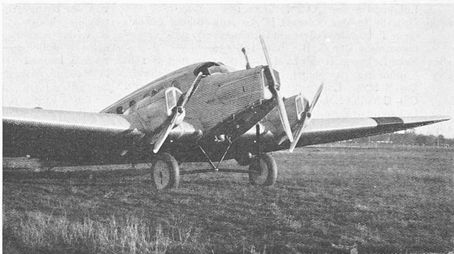
Vorderansicht des Junkers-Grossflugzeugs für 15 Reisende der am 1. Sept. 1925 eröffneten Fluglinie Zürich-Mailand.

stand 8,84 m, Gesamttrahndstand einschliesslich vierachsigen Tender rund 20 m. Die Zugkraft in Zwillingswirkung beim Anfahren soll 38200 kg, die mit Verbundwirkung 31800 kg betragen, zu denen noch 8920 kg Zugkraft einer im hintern Drehgestell des Tenders angeordneten Zusatzdampfmaschine (Booster) hinzukommen. Durch den erhöhten Druck allein werden 15% Kohlenersparnis erwartet, dazu noch eine wesentliche Ersparnis infolge des verbesserten Wirkungsgrades des Kessels. Versuchsergebnisse sind noch keine angegeben.