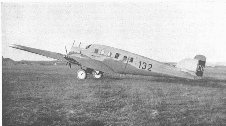
Junkers-Grossflugzeug für den Flugverkehr Zürich-Mailand.