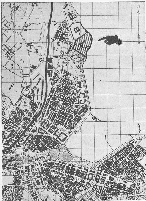
Abb. 1. Lageplan des für das Völkerbunds-Gebäude bestimmten Geländes (A) am Westufer des Genfersees in Genf. — Masstab 1 : 25 000. (B vorläufig nicht bebaubares Gelände. — BIT Internationales Arbeitsamt.)

Soweit zur Aufklärung über den bisherigen Entwicklungsgang und den heutigen Stand dieser Ausstellungshallen-Angelegenheit.