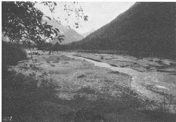
Abb. 2. Talboden bei Radin, taleinwärts, vor Baubeginn.