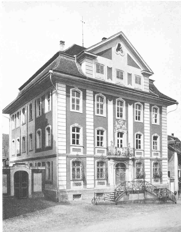
RATHAUS IN BISCHOFSZELL