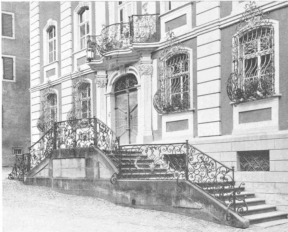
TREPPENAUFANG ZUM RATHAUS BISCHOF SZELL