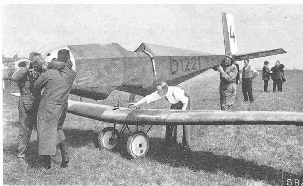
Abb. 35. Sportflugzeug „Messerschmitt M 19“ mit 35 PS Scorpion-Motor. Erzielte im Sachsenflug 1927 den ersten Preis.