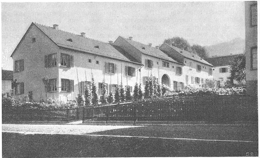
Abb. 2. Wohnkolonie der Heimgenossenschaft Schweighof am Friesenberg in Zürich.

Der Schweiz. Schulrat, die Eidgen. Techn. Hochschule, ihre Professoren, Dozenten und Assistenten, sie leben Hoch!