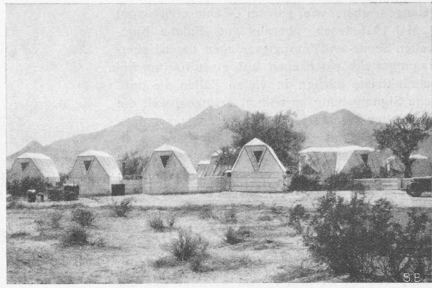
Abb. 3 und 4. Zeltbarackenlager nach Entwurf von Frank Lloyd Wright, im Hintergrund die San Tan-Mountains, Arizona, U. S. A.

verstanden erklären, dem ein solches Denkmal mehr bedeutet, als eine blosse Strassenverzierung. Hier wird nun Alfred Escher in jeder Hinsicht gut und am richtigen Ort stehen, an einem Orte, der dem Sinne nach mit dem zu Ehrenden in Beziehung steht. Hier gabelt sich die von Süden, vom Gotthard herkommende Hauptverkehrsader: neben der Bahn die Autostrasse, nach links (Alfr. Escher-Strasse) durch den alten N.O.B.-Tunnel nach Aussersihl und Richtung Baden, nach rechts (Mythen-Quai) ins Herz der Stadt. 1) Ueberdies steht das Denkmal direkt am Fusse von Eschers Wohnsitz, dem „Belvoir“, das samt dem grossen Park durch Schenkung von Eschers einziger Tochter in öffentlichen Besitz übergegangen ist. 2)