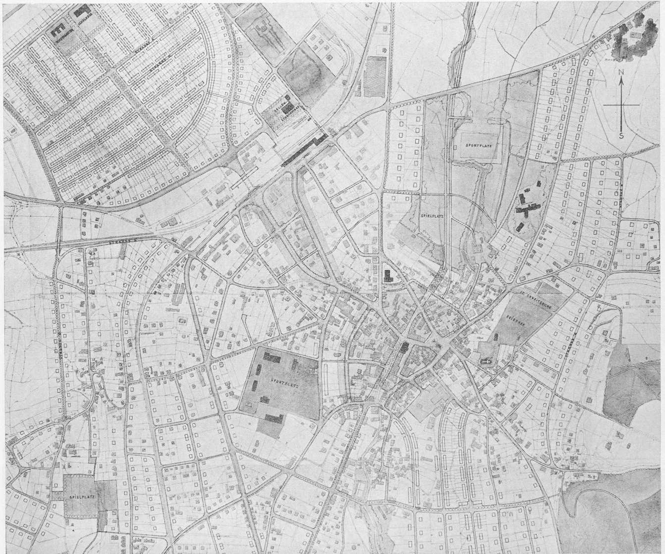
2. Rang (2800 Fr.), Entwurf Nr. 25. — Verfasser W. Schwegler & G. Bachmann, Arch., Zürich. — Masstab 1 : 10000.

strasse des Industriegebietes. Die Unterführungen sind in bezug auf die Strasseneinmündungen zu wenig studiert. Sowohl das Aufnahmegebäude der S.B.B. als auch jenes der L.J.B. sind von der Aarwangenstrasse nur mit verlorenem Gefäll zu erreichen. Die Quer-Verbindung Aarwangenstrasse über den Parkplatz bei der Sportanlage nach dem Krankenhaus befriedigt nicht. Der Gedanke, den Verkehr aus der Gabelung Lotzwil- und Mittelstrasse durch eine neue Diagonal-Verbindung unter Benützung des frei werdenden Bahntracé der L.H.B. nach der Eisenbahnstrasse, den Bahnhof und der Bützbergstrasse zu führen, bringt keine nennenswerten Vorteile, da das gleiche Ziel durch Ausbau der Ringstrasse bis zur Wiesenstrasse und den Bahnhofplatz erreicht werden kann. Der Verbindung von der Bützbergstrasse nach dem Punkt A der verlegten Murgenthalstrasse ist keine grosse Bedeutung beizumessen. Die Verbindung Schoren-Bützbergstrasse wäre an sich günstig, bedeutet aber einen grossen Umweg nach dem Bahnhof. Die neue projektierte Strasse parallel zur St. Urbanstrasse mit Niederlegung zahlreicher Gebäude entbehrt der Berechtigung, ebenso die starken Eingriffe beim alten Schulhaus und zum Zwecke der Schaffung des neuen Marktplatzes. — Die Erweiterung des Industriegebietes im Südwesten des Dorfes ist abzulehnen. Die Begrenzung der geschlossenen Bauzone ist im allgemeinen richtig. Die Vorschläge für die Revision der Bauordnung gehen in einzelnen Punkten zu weit (vier Geschosse im Dorfkern).