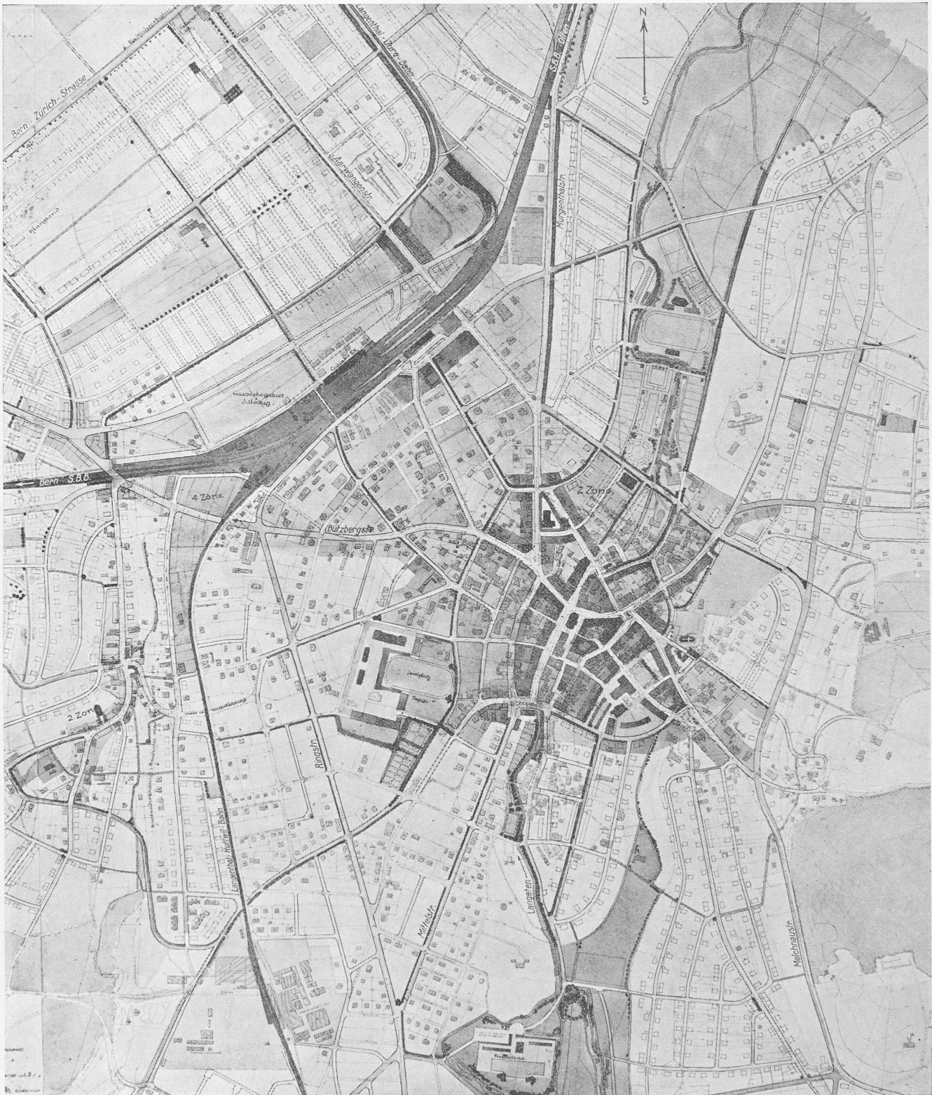
1. Rang ex aequo (3200 Fr.), Entwurf Nr. 2. — Verfasser Albert Schneider, Arch., Winterthur. — Masstab 1 : 10000.

etwas vorteilhafter, als der Weg nach dem Bahnhof kürzer wird. Im Dorfkern hat sich der Verfasser beschränkt auf eine Verbindung zwischen Theater über die Mühle nach der Gabelung der St. Urban- und der Steckholzstrasse, die annehmbar ist. Im übrigen bringt das Projekt keine nennenswerten Verbesserungen im Dorfkern. Die Ringstrasse im Norden ist unbegründet. — Das Industriegebiet ist zu reichlich bemessen. Die geschlossene Bauweise ist im allgemeinen richtig begrenzt. Allerdings dürfte sich empfehlen, sie längs der Bahnhofstrasse auszudehnen. Die Geschosszahl ist bei der geschlossenen auf drei und bei der offenen Bauweise auf zwei Voll-