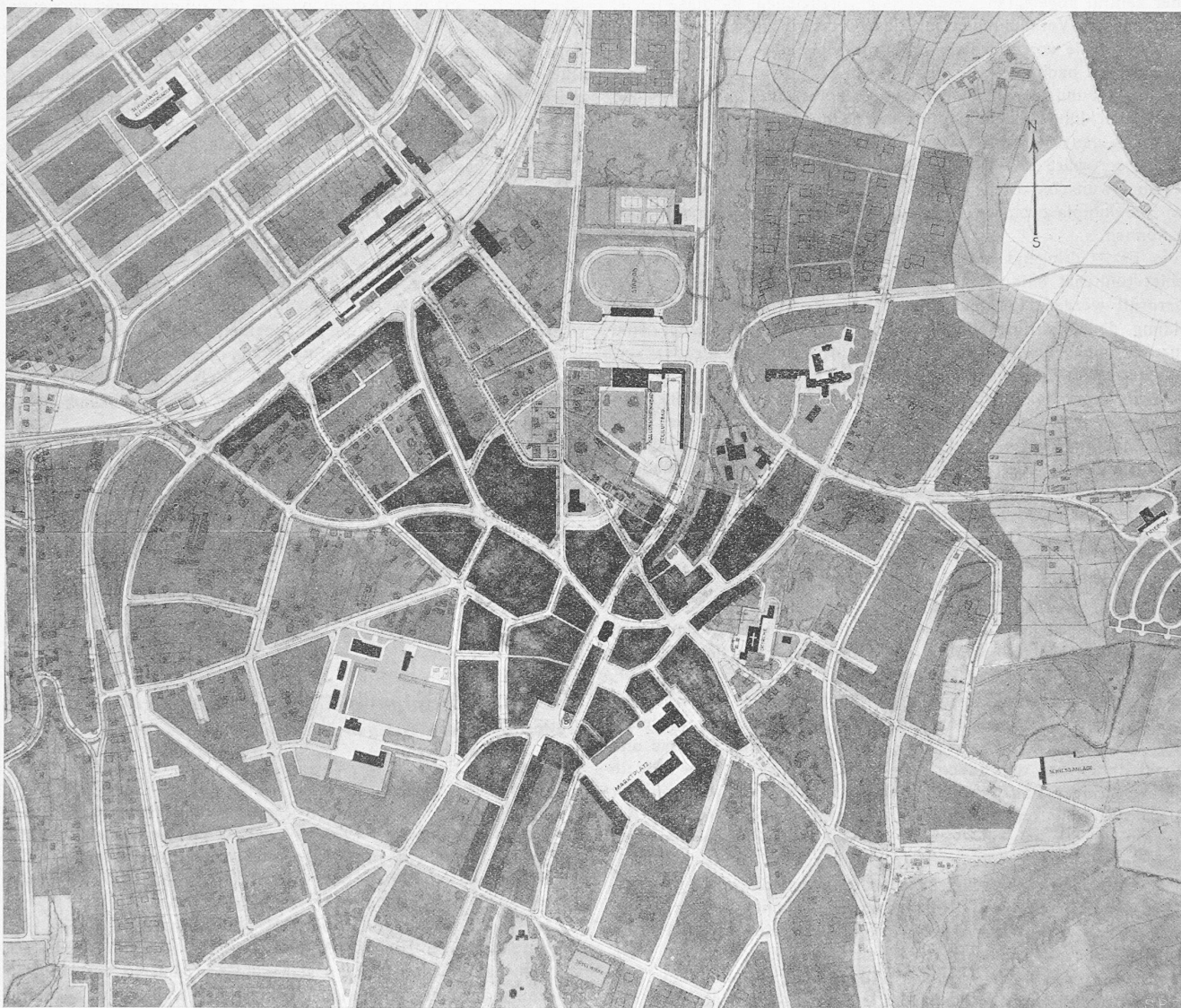
3. Rang (2600 Fr.), Entwurf Nr. 23. — Verfasser Karl Knell, Arch., Küsnacht-Zürich, Otto Dürr, Arch., Zürich, Theod. Baumgartner, Gemeindeg., Küsnacht-Zürich, Hektor Egger, Arch., Langenthal. — Masstab 1 : 10 000.

die etwas zufällige Abzweigung von der Bern-Zürichstrasse und die Ueberwindung der Unterführung bei der Ortschaft.