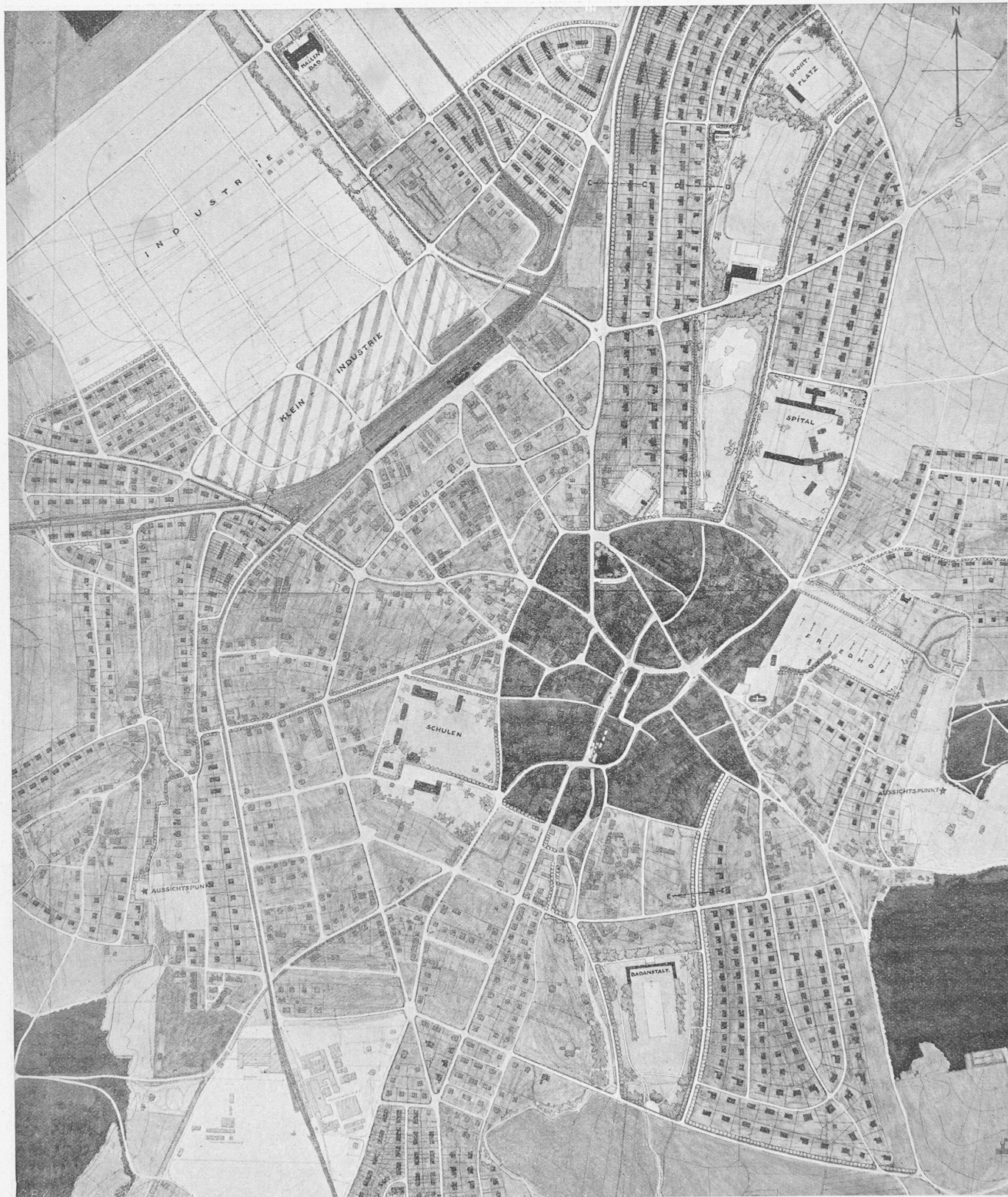
1. Rang ex aequo (3200 Fr.), Entwurf Nr. 19. — Verfasser Arthur Bräm, Gemeindeing., Kilchberg b. Zch.; Laubi und Bosshard, Arch., Zürich. — Masstab 1 : 10000.

Melchnastrasse verliert daher an Bedeutung. Mit Rücksicht auf die Umfahrungsmöglichkeit begnügt sich der Verfasser im Dorfkern nur mit einigen kleineren Korrekturen. Die Fortsetzung der Talstrasse nach der Jurastrasse hat keine Berechtigung. Die Verbindung von Schoren mit dem Bahnhof und der Bern-Zürichstrasse ist nicht gelöst (Kreuzung mit der S.B.B. und L.H.B. auf Schienenhöhe). — Die Ausdehnung der Zone für die geschlossene Bauweise ist zu beschränkt. Die Verteilung von Reihenhäusern und Einzelhäusern in der offenen Bauzone ist willkürlich. Die im Bericht niedergelegten Grundsätze für die Ausscheidung der Grünflächen sind bemerkens-