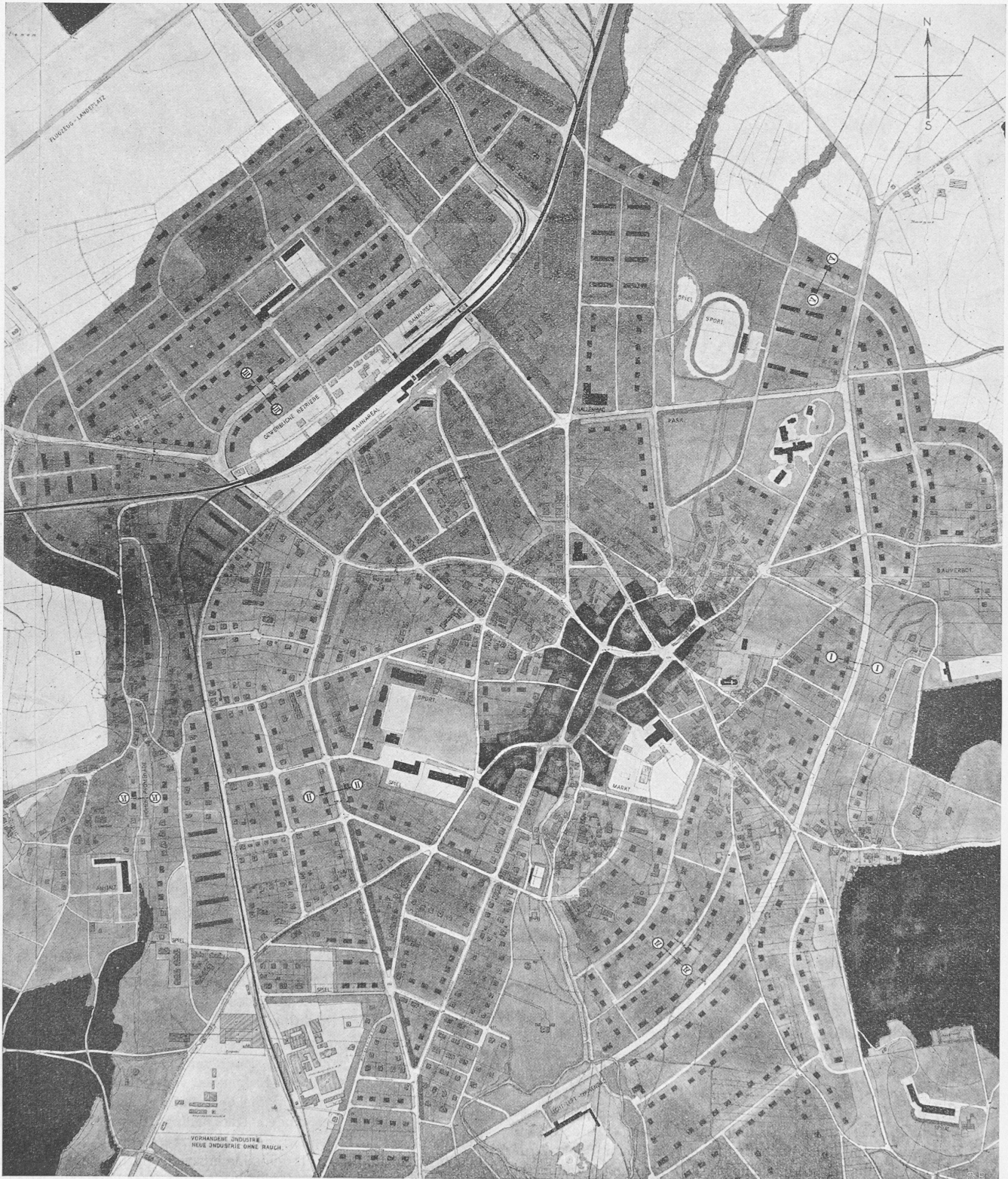
1. Rang ex aequo (3200 Fr.), Entwurf Nr. 30. — Verfasser J. Kräher, Arch., und J. Wichser, Arch., Zürich. — Masstab 1 : 10000.

mit der Eisenbahnstrasse verliert an Bedeutung durch die beiden Rampen bei der Unterführung (verlorene Steigung). Die Eingriffe im Ortskern durch Schaffung der beiden Plätze „Spitalplatz“ und „Löwenplatz“ sind sehr einschneidend, ohne dass dadurch wesentliche Verbesserungen für die Führung des Hauptverkehrs erzielt würden. Der Anschluss von Schoren vermittelt Ueberführung an die Bützbergstrasse ist zu loben, dagegen ist die Beibehaltung der Führung der Dorfstrasse Schoren nach dem Bahnhof auf Schienenhöhe der L.H.B. nicht empfehlenswert. — Die Vorschläge für die Zoneneinteilung und die Bauvorschriften sind im allgemeinen zu-