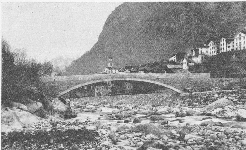
Abb. 12. Neue Maira-Brücke bei Castasegna-Casnaggio im Bergell.

bogen mit kastenförmigem Querschnitt, der von der Fahrbahn mit Brüstung, dem Stabbogen und den Quer- und Stirnwänden gebildet wird.