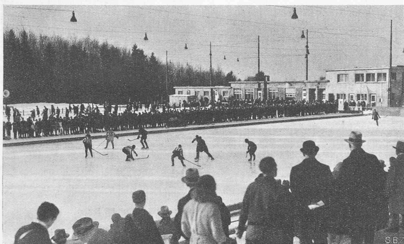
Abb. 1. Blick auf das Eisfeld gegen das Verwaltungsgebäude.