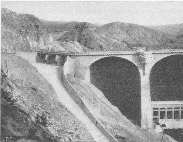
Abb. 1. Rechtsufriger Hochwasserüberlauf der Coolidge-Staumauer (U. S. A.).