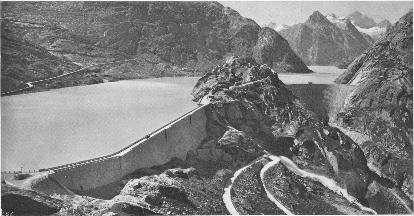
Abb. 2. Gesamtbild aus Nordost über Seufereggmauer, Nollen, Spitalamm-Mauer und Grimsel-Stausee. Rechts im Hintergrund das Finsteraarhorn.

standsfläche dritter Ordnung mit Korngrößen von x=R'' bis x = \log D :