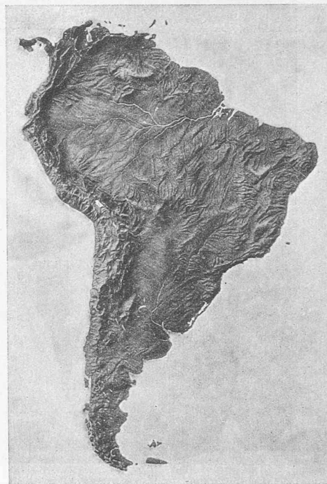
Abb. 1 (oben). Topographisches Relief von Südamerika. Abb. 2 (links). Karte der Kordillerenbahnen. — 1 : 50 Mill. Abb. 3 (unten). Längenprofile, 1 : 30 Mill., Höhen 1 : 100.000.