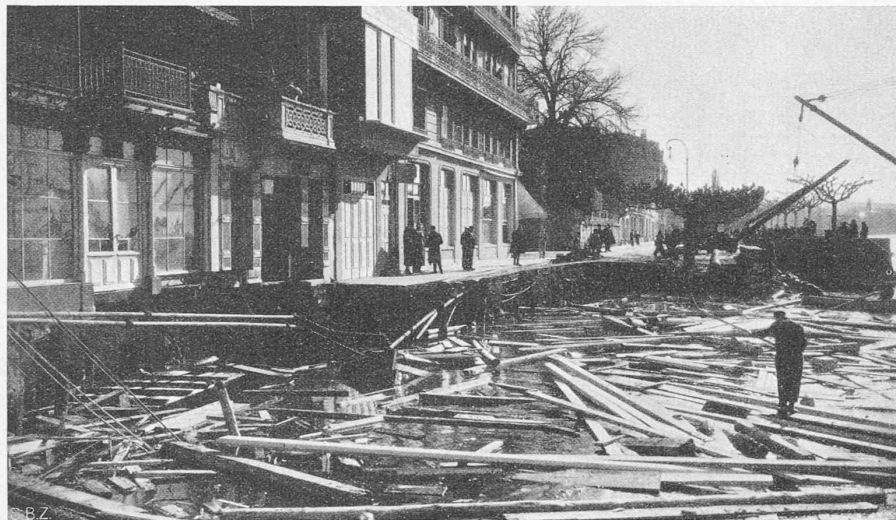
Abb. 9. Ansicht des Quai-Absturzes vom 22. März 1933, gegen Osten.