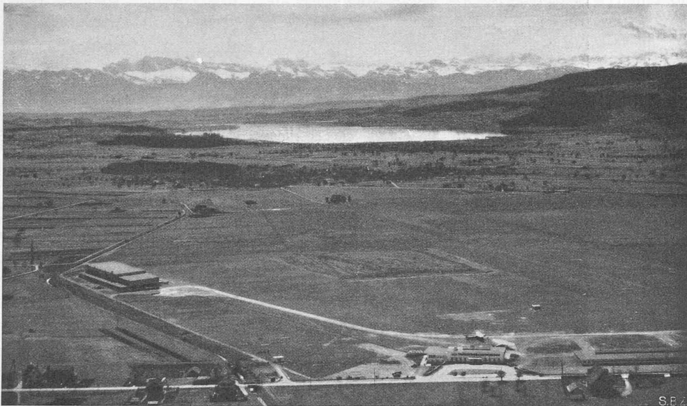
Abb. 1. Fliegerbild des Gesamtgeländes aus N-NW, im Hintergrund der Greifensee.