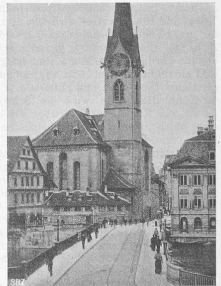
Abb. 5. Das Fraumünster in Zürich vor seiner Freilegung. Links Kaufhaus, rechts Meisen-Zunft.