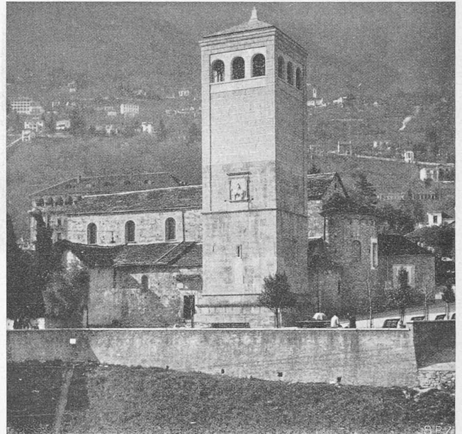
Abb. 2. San Vittore bei Locarno, mit dem anno 1930 aufgebauten Turm.

Noch vor wenigen Jahren war die Kirche San Vittore mit ihrem wuchtigen Turm und den kleinen, niedrigen Nebengebäuden (Abb. 1 und 3) ein architektonisches Denkmal. Leider mussten in den Jahren 1929-30, aus verkehrstechnischen Gründen, die Nebengebäude weichen, doch die Kirche und der Turm blieben erhalten. Im Jahre 1932 erhielt nun ein junger Architekt aus Lugano den Auftrag, den im sechs-