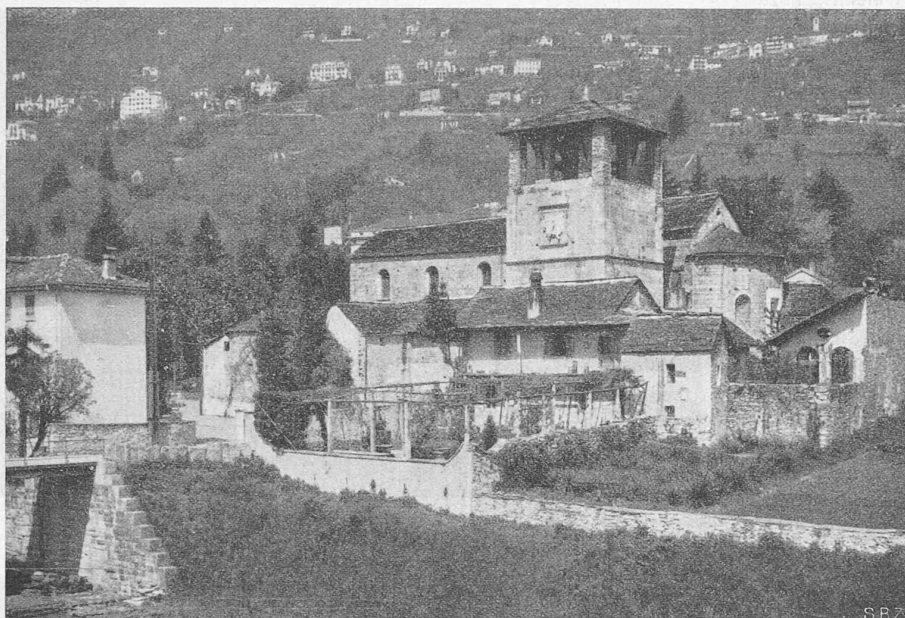
Abb. 3. San Vittore in Locarno-Muralto, Gesamtbild vor dem Jahre 1929.