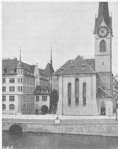
Abb. 6. Das freigelegte Fraumünster; das Portal (rechts) ist neu, auch das Stadthaus (links).

Anmerkung der Redaktion. Man beachte, wie unbedeutend klein das Relief in der neuen, gewaltig vergrösserten Fläche erscheint, im Vergleich mit seiner frühern Wirkung; dabei sind die Abb. 2 u. 3 auf genau gleichen Masstab gebracht. Ferner wie dünn der neue Turm geworden ist, im Vergleich zum frühern Zustand, wo er die wuchtige Dominante in der Baugruppe war, trotz seines primitiven Abschlusses. Aber gerade der Kontrast des bäuerlich-luftigen Aufbaues mit dem feudalen Relief hat dieses in seinem architektonischen Eindruck noch gesteigert. Weil dieses Beispiel das Geheimnis aller architektonischen Kunst: die Wechselwirkung