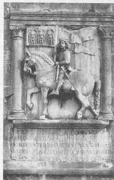
Abb. 4. Marmorrelief am Turm.

der einzelnen Bauteile aufeinander, so drastisch enthüllt, ist es lehrreich, besonders in unserer Zeit, die, nicht nur hier in Locarno, den Sinn für diese Beziehungen mehr und mehr verliert. Es erinnert an die vor etwa 30 Jahren vorgenommene „Säuberung“ des Fraumünsters in Zürich, dessen Grössenwirkung man, ohne Zutut, lediglich durch Wegnahme der massstabgebenden kleinen Anbauten empfindlich geschädigt hat (Abb. 5 u. 6, aus „S. B. Z.“, Bd. 66, Seite 229). Man decke einmal mit der linken Hand die linksstehende Abb. 6 zu und betrachte im ursprünglichen Bilde zunächst den Chor der Kirche und die an ihrem Fuss wie Schwalbennester angeklebten Häuschen, dann rechts das Zunfthaus zur Meise, links das (heute verschwundene) alte Kaufhaus, dann wieder die Kirche mit ihren — verhältnismässig — imposanten Chorfenstern. Dann werfe man unvermittelt den Blick auf Abb. 6, den heutigen Zustand, und man hat den Eindruck, die Kirche schrumpfe förmlich zusammen; und dabei ist sie auf beiden Bildern massstäblich genau gleich gross. — Es besteht eben nichts für sich allein, alles erhält (oder verliert) seine Bedeutung nur in seinen Beziehungen zur Umwelt.