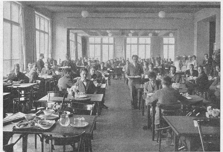
Abb. 5. Café und Mensa I im Erdgeschoss des Studentenheims.

Bezüglich der Frequenz sind sofort die kühnsten Hoffnungen erfüllt worden. Schon gegen Ende 1930 wurden bereits mehr als 500 Mittagessen und etwa 450 Abendessen eingenommen. Im Wintersemester 1931/32 stiegen diese Zahlen auf 750 bzw. 600. Auch die allgemeinen Räume (Sitzungs-