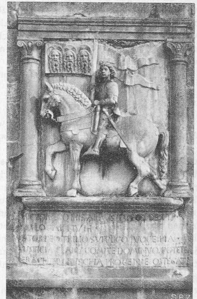
Abb. 4. Marmorrelief am Turm.

der einzelnen Bauteile aufeinander, so drastisch enthüllt, ist es lehrreich, besonders in unserer Zeit, die, nicht nur hier in Locarno, den Sinn für diese Beziehungen mehr und mehr verliert. Es erinnert an die vor etwa 30 Jahren vorgenommene „Säuberung“ des Fraumünsters in Zürich, dessen Grössenwirkung man, ohne Zutut, lediglich durch Wegnahme der massstabgebenden kleinen Anbauten empfindlich geschädigt hat (Abb. 5 u. 6, aus „S. B. Z.“, Bd. 66, Seite 229). Man decke einmal mit der linken Hand die linksstehende Abb. 6 zu und betrachte im ursprünglichen Bilde zunächst den Chor der Kirche und die an ihrem Fuss wie Schwalbennester angeklebten Häuschen, dann rechts das Zunfthaus zur Meise, links das (heute verschwundene) alte Kaufhaus, dann wieder die Kirche mit ihren — verhältnismässig — imposanten Chorfenstern. Dann werfe man unvermittelt den Blick auf Abb. 6, den heutigen Zustand, und man hat den Eindruck, die Kirche schrumpfe förmlich zusammen; und dabei ist sie auf beiden Bildern massstäblich genau gleich gross. — Es besteht eben nichts für sich allein, alles erhält (oder verliert) seine Bedeutung nur in seinen Beziehungen zur Umwelt.