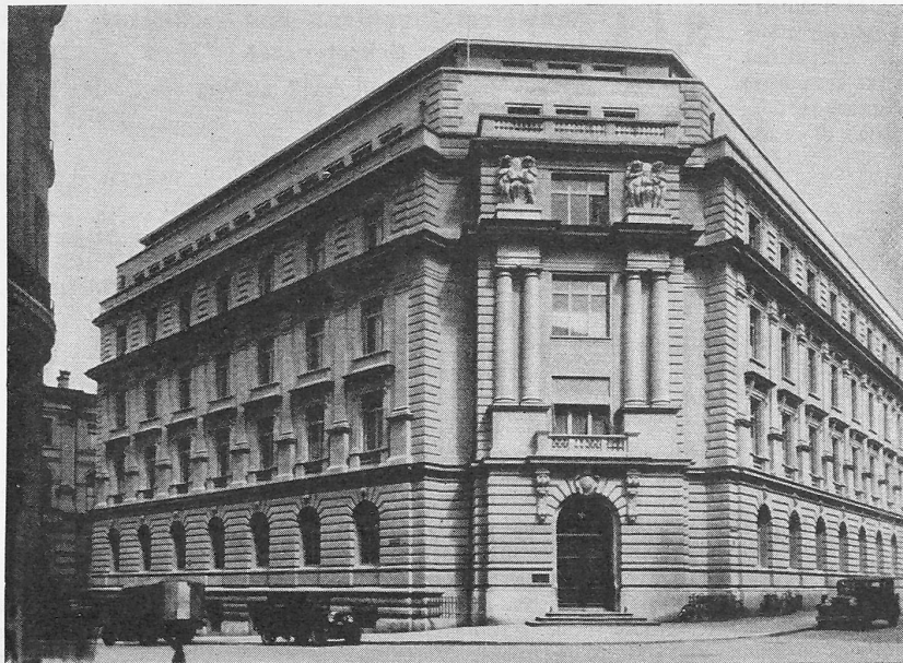
Abb. 2. Das Gebäude nach dem Aufbau (1933) der zerstörten Obergeschosse.