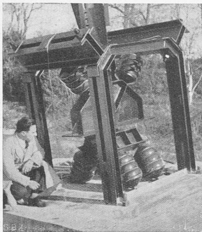
Abb. 4. Isolierter Turmfuss Monte Ceneri.

einzigem Sender, der „Impianto nazionale del Monte Ceneri“ zur Verfügung. Der Aufstellungsort und die Leistung dieser Sender sind so gewählt, dass in jedem Sprachgebiet eine möglichst grosse Zahl von Hörern bedient werden kann. Die Aufnahmestellen (Studio) sind in bedeutenden Städten untergebracht, um auf diese Weise einen festen Kontakt mit dem Theater, den Konzertsälen und dem literarischen Leben zu sichern. Wir besitzen so Studio-