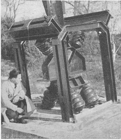
Abb. 4. Isolierter Turmfuss Monte Ceneri.

einzigster Sender, der „Impianto nazionale del Monte Ceneri“ zur Verfügung. Der Aufstellungsort und die Leistung dieser Sender sind so gewählt, dass in jedem Sprachgebiet eine möglichst grosse Zahl von Hörern bedient werden kann. Die Aufnahmestellen (Studio) sind in bedeutenden Städten untergebracht, um auf diese Weise einen festen Kontakt mit dem Theater, den Konzertsälen und dem literarischen Leben zu sichern. Wir besitzen so Studio-