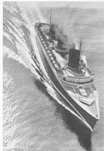
Abb. 2. Bugansicht der „Normandie“, mit schlanker Wasserlinie und Bugwelle, in voller Fahrt.

Für die Wahl des von der „Als.-Thom.“, Belfort, gelieferten Antriebs der vier dreiflügligen Schrauben war die Forderung bestimmend, bei flauer Frequenz eine ökonomische Gangart bei reduzierter Geschwindigkeit einschlagen zu können: Jede Schraubenwelle wird von einem (asynchron anlaufenden) 5500 V-Synchronmotor für 40 000 PS Dauerleistung bei 243 Uml/min und 81 Hz (32 500 PS optimaler Leistung bei 225 Uml/min) angetrieben, der den Strom von einer Turbogruppe für 33 400 kW bei 2430 Uml/min bezieht. Abgesehen von der denkbar einfachen Umstellung auf die (bei voller Leistung mögliche) Rückwärtsfahrt durch Umschaltung der Stromrichtung, gestattet der turboelektrische Antrieb für den Winterbetrieb, ausser der Drehzahlverminderung aller vier Turbogruppen, deren zwei stillzulegen und die beiden Schraubenmotoren einer Schiffseite aus einer gemeinsamen Turbogruppe zu speisen, wobei übrigens die Sommerschrauben gegen solche für verminderte Umlaufzahl (entsprechend etwa 24 kn) ausgewechselt werden können. In Bd. 101, S. 26 und Bd. 104, S. 226 sind die Hauptdaten des Schiffes angegeben. Eine eingehende Beschreibung gibt O. Quéant in „Génie Civil“ vom 18. und 25. Mai. Der Rumpf aus Siemens-Martin-Stahl wiegt rd. 30 000 t; an Masut (für 33 Dampfkessel) werden 8930 t, an Süswasser 6600 t mitgeführt; 103 t Schmieröl zirkulieren! Der Gleichstromversorgung dienen sechs Turbogruppen zu je 2200 kW, für den Notfall zwei bei aussetzender Spannung automatisch anlaufende Dieselaggregate zu je 150 kW.