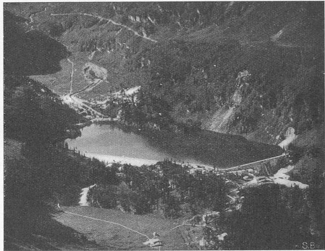
Abb. 24. Das gefüllte Staubecken Garichte aus Norden.