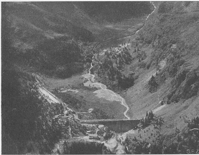
Abb. 23. Das Staubecken „Garichte“, im Hintergrund „Matt“.