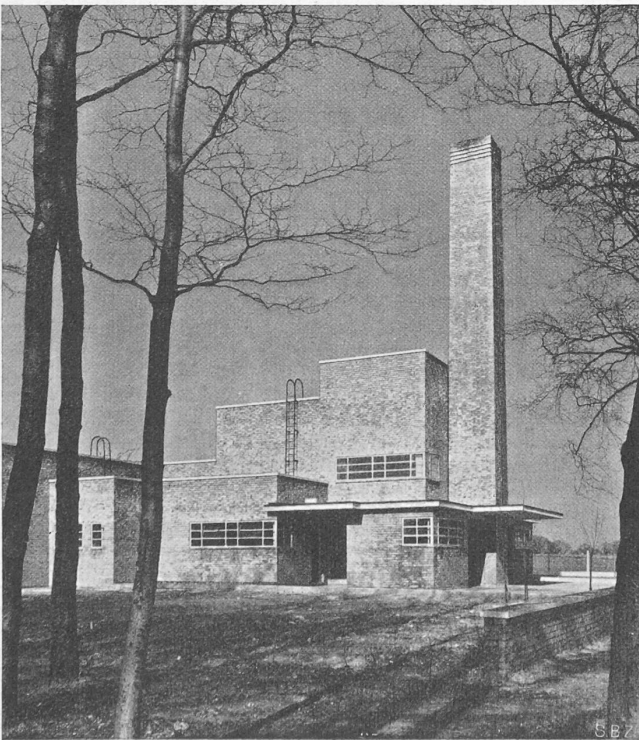
Abb. 21. Bergarbeiter-Bad in Snowdon, Kent. Architekt C. G. Kemp.

Photoelektrischer Reflexionsmesser. Zum Vergleich des Reflexionsvermögens, der Farbe und der Transparenz von Metall-, Glas- und Holzwänden, Anstrichen, Papier-, Porzellan- und Textil-