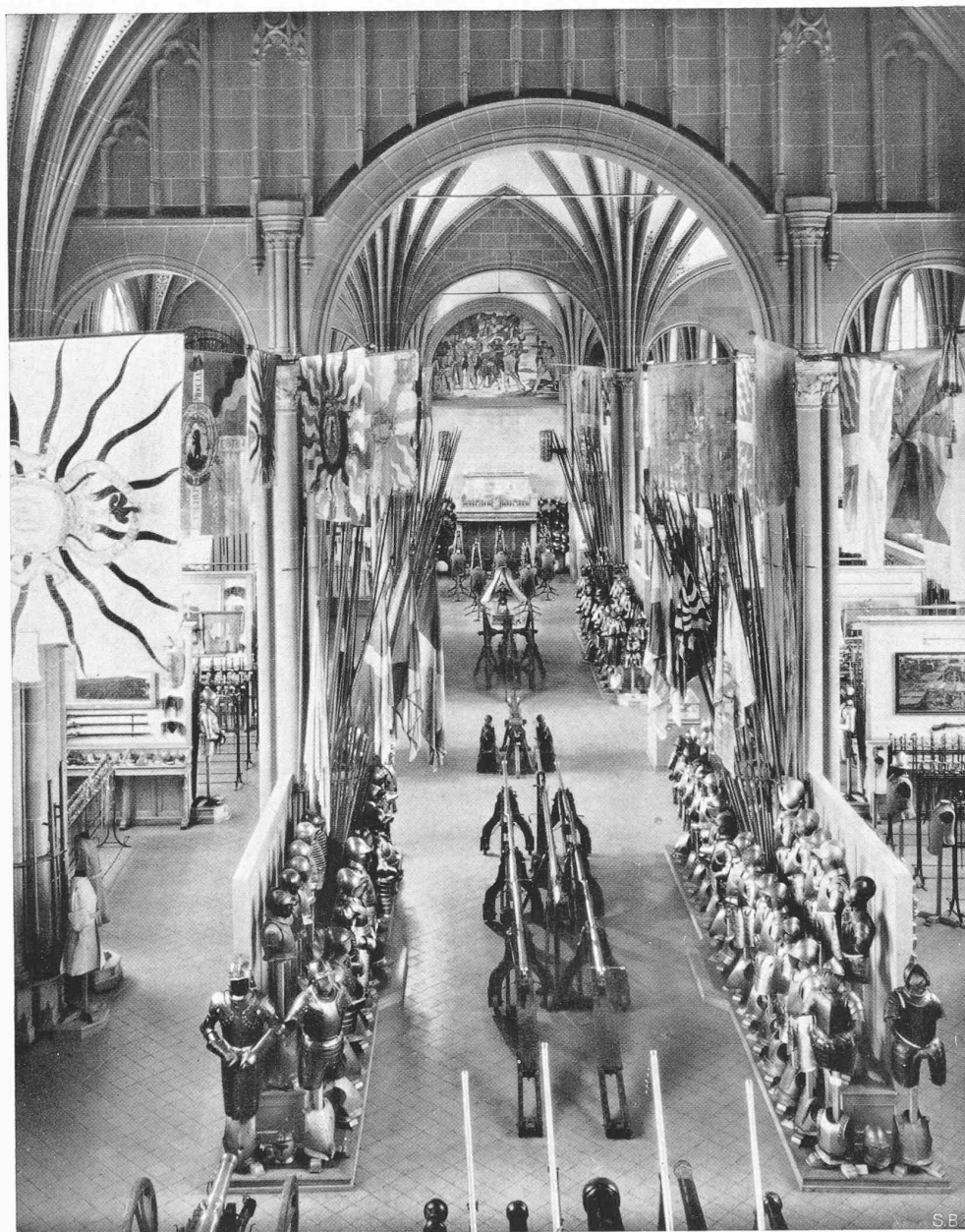
DAS SCHWEIZERISCHE LANDESMUSEUM IN ZÜRICH FREIGELEGTER DURCHBLICK DURCH DIE GROSSE WAFFENHALLE MIT DEN MARIGNANO-FRESKEN VON FERD. HODLER