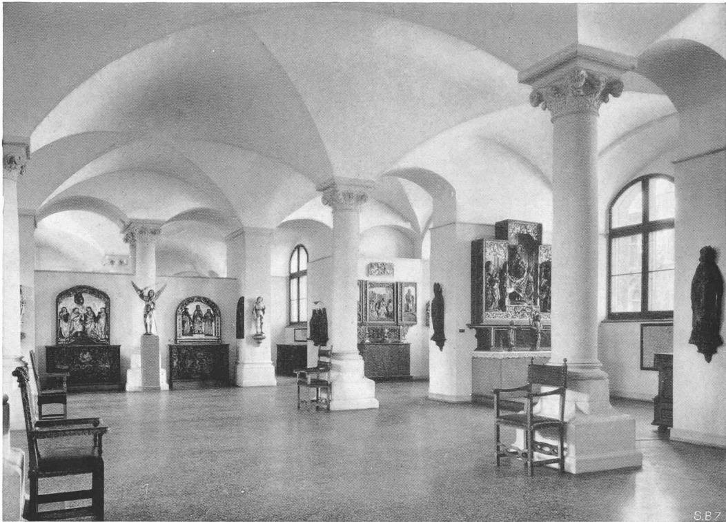
KIRCHLICHE KUNST DES 16. JAHRHUNDERTS IM MITTELSAAL 2b DES ERDGESCHOSSES Altäre aus Seewis (Ilanz), Kazis, Schloss Wartensee und Naters (Wallis)