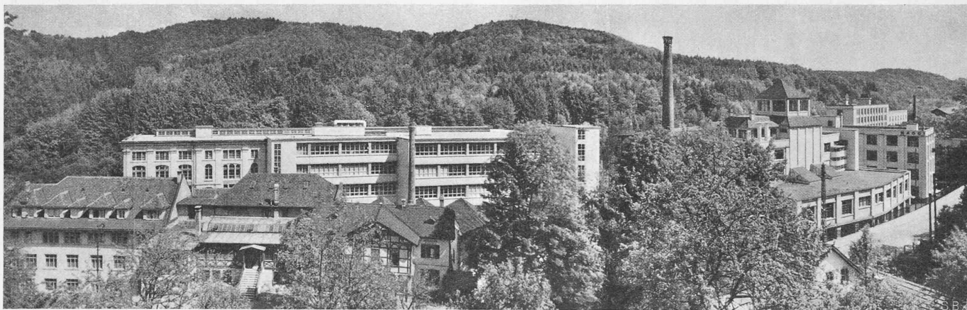
Abb. 3. Gesamtbild aus Westen: Links Verwaltung, dahinter Altbau, rechts anschliessend Neubau; dann Erbs-Silo und Mühlegebäude.