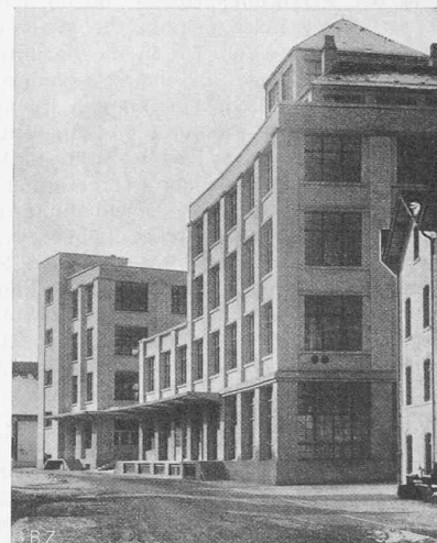
Abb. 2. Erbs-Silo und Mühlegebäude, westl. der Fabrikstrasse. Architekten Debrunner & Blankart.

In den Neubau der Abteilungen Spedition und Fassung musste der hierfür bestehende Bau mit einbezogen werden. Massgebend für die Lage und die Grundrissform waren auf den beiden Längsseiten einerseits das bestehende private Anschlussgleise der Fabrikstrasse, andererseits das vorhandene S. B. B.-Gleise der Station Kempttal (Abb. 3). Die beiden Schmalseiten begrenzen im Norden der Altbach, im Süden der Kemptbach; dieser musste teilweise überdeckt und überbaut werden; verschiedene alte Holzbauten mussten dem Neubau weichen.