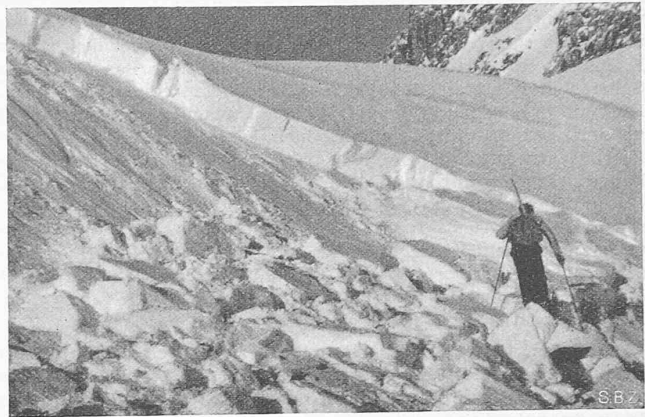
Abb. 12. Anbrüchecke rechts unten in Abb. 11; links die Gleitfläche

messung von Lawinenverbauungen nutzbar gemacht werden. Schneedruckmessungen grösseren Stils befinden sich in Vorbereitung. Im Zusammenhang mit Deformationsmessungen an der Schneedecke dürfte es auf diesem Wege gelingen, Richtlinien betreffend die wirtschaftlich günstigste Form und Verteilung der Verbauungen (für die in der Schweiz jährlich nahezu eine Million Franken aufgewendet werden) aufzustellen.