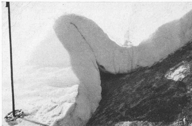
Abb. 2. Querschnitt einer Schneefalte auf grasbedecktem Boden (Bildung in mehreren Tagen)

rd. 10 kg/PS, bei modernen Auto-Dieselmotoren sogar nur 5 kg/PS. Für den Flugmotor ist auch dies noch zu viel; er verlangt, um zu fliegen, 0,5 kg/PS! Die Frage, ob der hochentwickelte Benzin-Flugmotor durch einen überlegenen Oelmotor zu verdrängen sei, ist noch nicht entschieden. Der Wunsch, den Kolben-Verbrennungsmotor durch eine rotierende Verbrennungsturbine zu ersetzen, ist alt und unerfüllt. Einstweilen beschäftigt der Gedanke einer Zwischenlösung unternehmende Ingenieure: die Freiflugkolbenmaschine, vielleicht bekannter unter andern Namen, sei es als Pescara-, sei es als Junkersmotor.