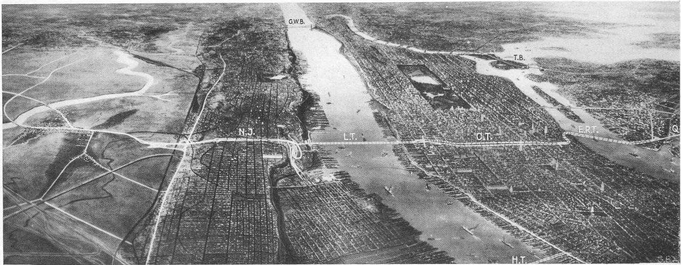
Abb. 2. Flugbild aus SW auf New Jersey, Manhattan und Queens (Q) mit Lincoln-Tunnel, Crosstown-Tunnel und East River-Tunnel nach Queens. Im Hintergrund George Washington-Brücke, im East River Triborough-Brücke; ganz vorn der Holland-Tunnel. Der auf dem Bilde sichtbare Hudson-Fluss vom Holland-Tunnel bis zur G. W.-Brücke hat ungefähr die Ausdehnung des Wallensees (vergl. Abb. 1)