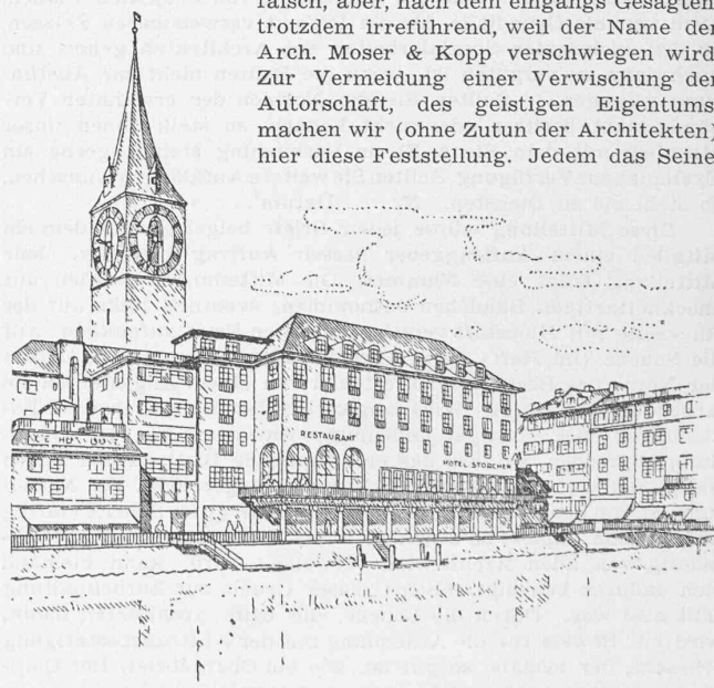
Der neue «Storchen» in Zürich, nach dem Vorentwurf der Arch. Moser & Kopp

Neubau des Hotel Storchen in Zürich. Die Südwand des Weinplatzes mit dem «Roten Turm», in dem vor 100 Jahren der «Zürcher Ing. und Arch.-Verein» gegründet worden ist (vgl. Abb. 3 in Bd. 111, S. 311), musste kürzlich einem Neubau zum Opfer fallen, dessen äussere Erscheinung an dieser exponierten Stelle, gegenüber dem Rathaus, besonders sorgfältig zu überlegen war. Der Entwurf der Arch. Moser & Kopp ist daher der kant. Heimatschutz-Kommission zur Begutachtung vorgelegt und von dieser in der hier abgebildeten Form gutgeheissen worden. Unmittelbar vor Baubeginn ging dann der Bauplatz durch Verkauf in andere Hände über und damit auch der Bauauftrag an den Architekten des neuen Besitzers, Dr. Erh. Gull. In der N. Z. Z. vom 26. Juni (Nr. 1140) findet sich eine Beschreibung des geplanten Neubaus, der untenstehendes Bild entnommen ist. Dabei heisst es im Text: «Der neue Storchen wird nach den Plänen und unter Bauleitung von Arch. Dr. Erh. Gull erstellt; die Fassadengestaltung erfolgt unter Anpassung an die bereits von der kant. Natur- und Heimatschutz-Kommission genehmigten Vorlagen.» — Diese Darstellung ist nicht falsch, aber, nach dem eingangs Gesagten, trotzdem irreführend, weil der Name der Arch. Moser & Kopp verschwiegen wird. Zur Vermeidung einer Verwischung der Autorschaft, des geistigen Eigentums, machen wir (ohne Zutun der Architekten) hier diese Feststellung. Jedem das Seine.