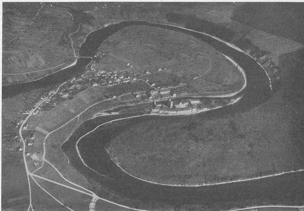
Abb. 7. Flusschleife bei Rheinau, Fliegerbild aus Süden (der Rhein tritt rechts unten ins Bild)

«So wehren wir uns denn heute mit aller Kraft gegen den Versuch, ohne überzeugende Notwendigkeit Kostbarstes und Liebtes im Wunderwerk unserer Heimatbilder zu zerstören, und wir betrachten es als ein erstes Gebot, dass unser Volk sich auflehne gegen ein Geschenk, das es um wertvollen Besitz ärmer macht. Ich denke, dass Sie ohne weiteres mit mir einverstanden sind, wenn ich erkläre: wir können nicht hinnehmen, dass z. B. der Wasserspiegel des Rheinfallbeckens während rund zwei Dritteln