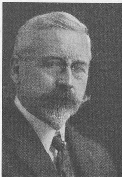
CHARLES ED. GUILLAUME

Directeur du Bureau International des Poids et Mesures, Sèvres