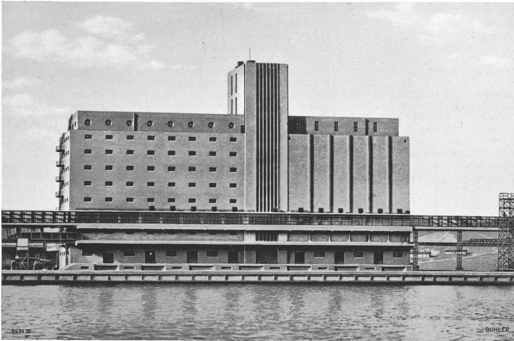
Abb. 1. Neuer Getreidesilo in Gdingen, entworfen und maschinell ausgerüstet durch Br. Bühler, Warschau