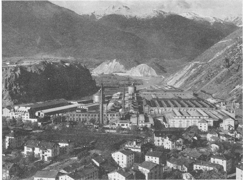
Abb. 3. Aluminium-Hüttenwerk Chippis der A. I. A. G., im heutigen Umfang

Metall liegenden Möglichkeiten berät und ihn von Fehlverwendungen abhält. Nur wenn die Verwendung von Aluminium an Stelle bisher gewohnter Werkstoffe einen technischen oder wirtschaftlichen Vorteil mit sich bringt, ist es möglich, einen Dauererfolg zu erzielen. Auf Augenblickserfolgen kann kein Weltabsatz aufgebaut werden.