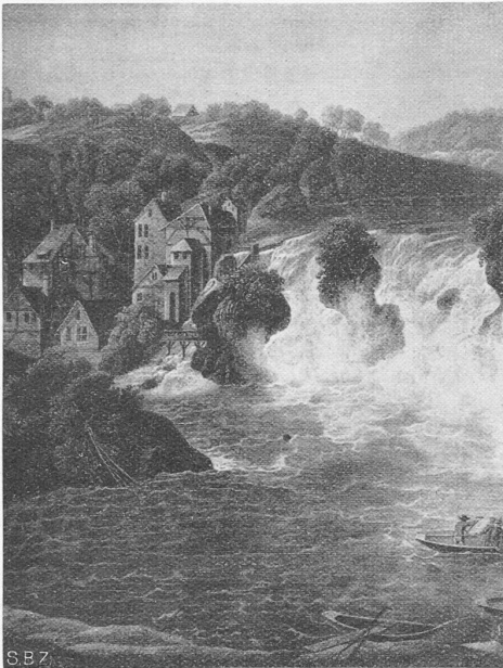
Abb. 2. Die alten Mühlen am Rheinfall