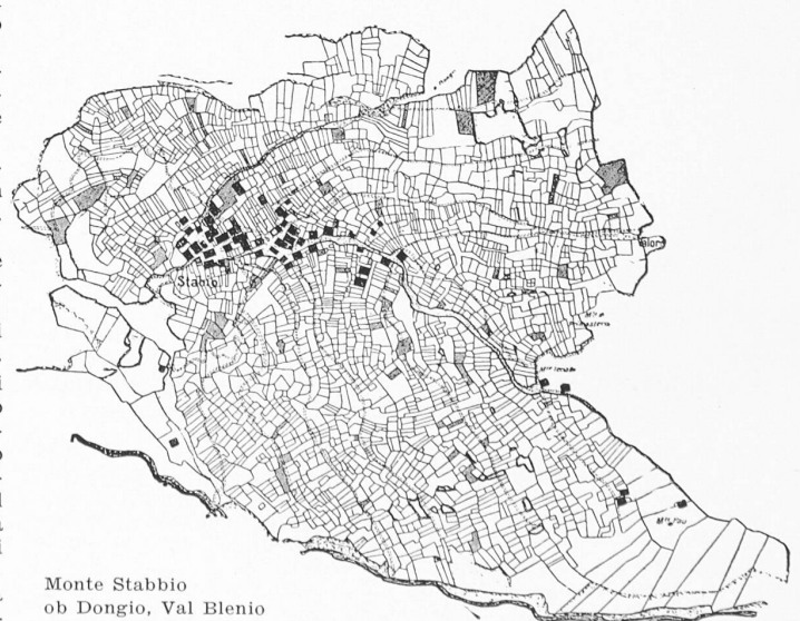
Monte Stabbio ob Dongio, Val Blenio

Flächeninhalt 18 ha, Bodenwert 5 bis 20 Rappen/m 2 . — Masstab rd. 1 : 6000 Alter Bestand 2630 Grundstücke, verteilt auf 58 Grundeigentümer Ein Eigentümer besass 80 kleine und kleinste Parzellen (schraffiert)