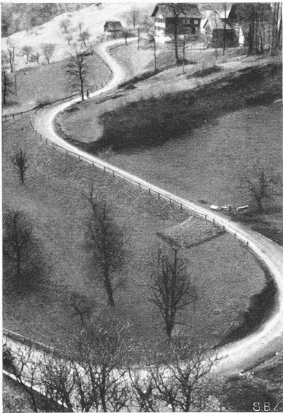
Abb. 1. Güterweg Gräpplang-Fäsch, 2,5 m breit