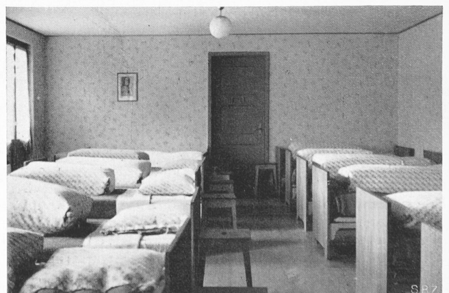
Mädchenschlafsaal im ersten Stock