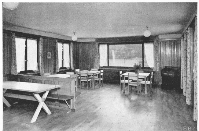
Abb. 7. Grosser Tagraum, Blick nach Süden