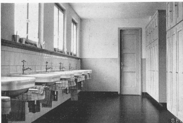
Abb. 4. Waschraum vor dem grossen

Tabelle 3 gibt die Motorleistungen in PS im Betrieb; diese sind natürlich viel kleiner als die installierten Leistungen, was vom Einfluss des natürlichen Luftzuges herrührt, der für die Ausbaugröße, nicht aber für die Berechnung der Betriebsleistungen voll zu berücksichtigen ist. Auftrieb in den Schächten z. B. wirkt dem abwärtsziehenden Frischluftstrom entgegen und