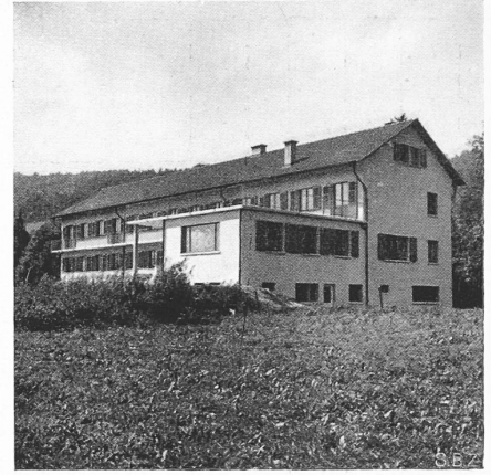
Abb. 3. Aus Südost

vermehrt hier den Widerstandsdruck, den das betr. Gebläse und sein Motor zu überwinden haben, und für den beide ausgebaut sein müssen. Das selbe gilt für die Abluftgebläse, die gelegentlich einen negativen Auftrieb (z. B. im Sommer) müssen überwinden können. Diese erhöhten Leistungen treten aber niemals zusammen auf. Der natürliche Luftstrom, der den Widerstand des Frischluftstromes erhöht, entlastet den Ventilator auf der Abluftseite. Das selbe gilt für das barometrische Druckgefälle, das immer nur die Luftströme der Ventilation in einer Richtung gleichzeitig belastet. Die maximale Druckerhöhung infolge der möglichen Gegenwirkung eines natürlichen Luftzuges muss für die Berechnung der Leistungsfähigkeit sämtlicher Teile der Anlage voll berücksichtigt werden, nicht aber für die Berechnung der Betriebsbelastungen, da der Belastung der einen Hälfte der Lüftungsanlage eine teilweise Entlastung der andern durch den natürlichen Luftzug entspricht. Für die Berechnung des Dauerbetriebes setzte die Kommission in ihren Beispielen für den Auftrieb der Schächte und das barometrische Gefälle, da es sich um kein bestimmtes Projekt handelte, für das genauere Untersuchungen angestellt werden konnten, willkürlich \frac{1}{3} der für die Ausbaugrösse angenommenen Maxima ein. — Sowohl bei den Leistungsberechnungen, wie in den Kostenvoranschlägen, ist die Tiefe der Schächte, sowie ihre symmetrische Anordnung ganz willkürlich angenommen worden.