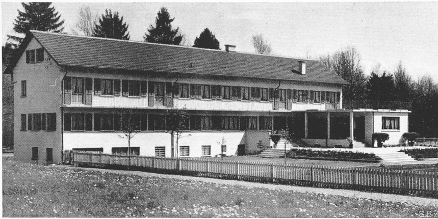
Abb. 2. Aus Südwest