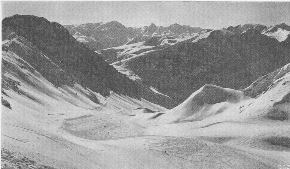
Abb. 3. Blick vom Weissfluhjoch gegen SW: Hauptertäli, Strelaweg u. -Pass; Piz d'Aela, Tinzenhorn, Michel